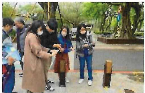
112年03月28日博雅盟參訪大溪高中 觀摩自主學習課程