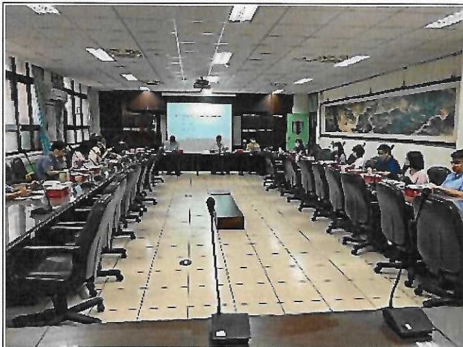
1. 主席 松山高中 陳清誥校長 主持111-1陽明百山組區域諮詢會議