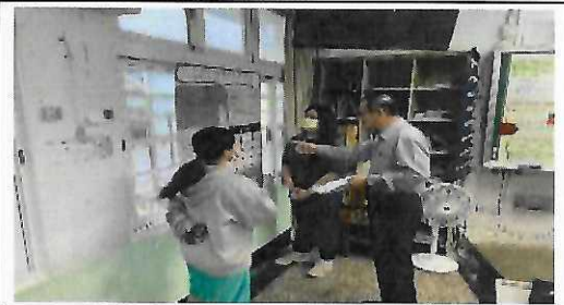
112年5月26日校訂必修專題海報發表會， 邀請合作大學教授蒞臨指導、建議。