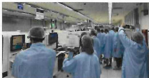
112年7月5日企業參訪 參訪新漢電腦無塵室