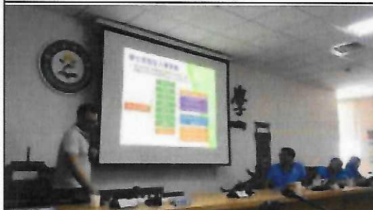
112年7月5日博雅盟三校赴東華大學參訪 東華大學介紹入學管道