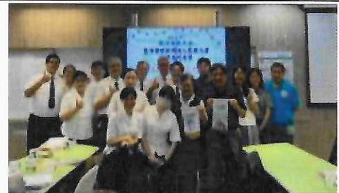
112年6月14日慈濟大學附屬高中來訪， 交流兩校校本課程