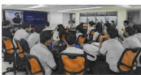
112年7月12日區域聯盟學校企業參訪 參訪大同世界科技公司