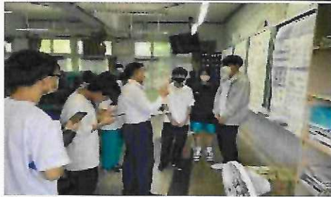
112年5月26日校訂必修專題海報發表會， 邀請合作大學教授蒞臨指導、建議。