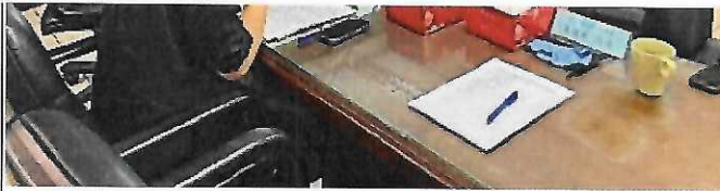
3. 松山高中 林育瑛主任 說明高中與大學學習歷程檔案深度對話論壇活動相關資訊