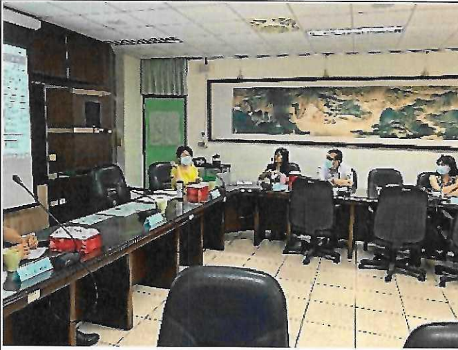
5. 師範大學 陳玉娟 教授給予建議及勉勵