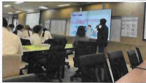
112年6月14日慈濟大學附屬高中來訪，交 流兩校校本課程