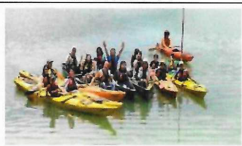
112年7月5日博雅盟三校赴東華大學參訪 教師團隊進行泛舟體驗活動